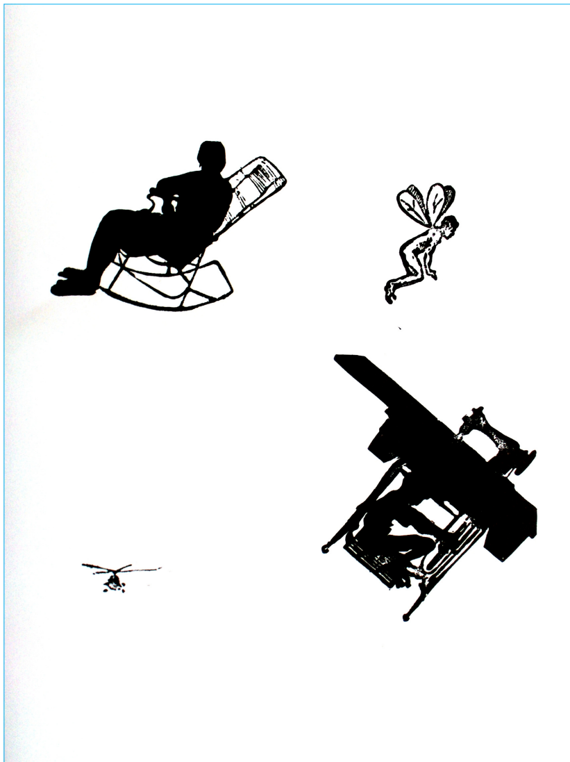
GABRIEL ACUÑA RODRÍGUEZ Nuevo orden , de la serie "La basura de los días" Xilografía – linograbado, 50 X 35 cm (2007)