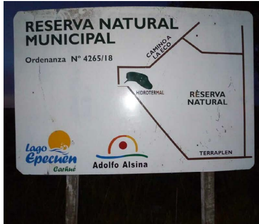
Figura 3: Cartel, colocado en la zona donde se asentaba la familia Pita de Carhué, que anuncia la Reserva Natural Municipal y su delimitación (según la Ordenanza N° 4265/18).

Luego del trabajo conjunto de la comunidad con el grupo (UBANEX-UBACYT) para los papeles de la personería jurídica, surgieron otras colaboraciones y pedidos. Vemos que en la entrevista de la Radio “FM Sueños” la Lonka buscó resaltar cuáles son las instituciones que los respaldan y, además, la importancia que implica para la comunidad conseguir el apoyo de las autoridades. De manera detallada contó todo lo que están haciendo para lograr sus objetivos: juntar firmas, la solicitud al grupo UBANEX de elaborar una carta que avale y constatare el pedido de las tierras de la familia Pita y el contacto con distintos organismos y abogados del CPAI y del INAI. Asimismo resaltó: