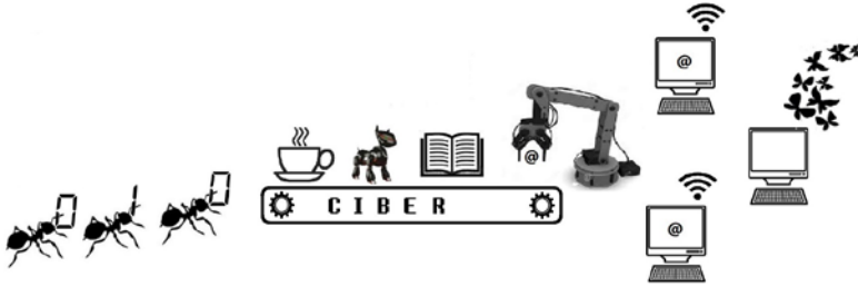
Figura 1. Arqueología del prefijo ciber.

Su uso advierte la emergencia de una cultura ligada a los desarrollos de la cibernética, las nuevas comprensiones de la biología, la tecnología, la sociología y los usos culturales de la tecnología en la sociedad del conocimiento, pero plantea grandes retos relacionados con la investigación y la construcción de conocimiento transdisciplinar (figura 1).