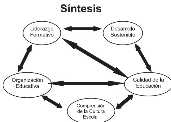
Figura 1: Categorías de análisis del proyecto de investigación

Durante el desarrollo de esta investigación se construyó conocimiento a partir de la comprensión de la realidad empírica particular, con la iluminación a lo extenso del proyecto de las categorías de análisis.