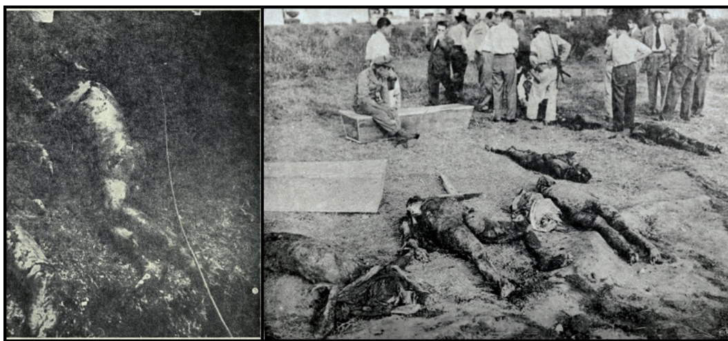
Fuente: Secretaría de Divulgación y Propaganda (1954, pp. 99, 105); CEUA (1955, pp. 366, 372).