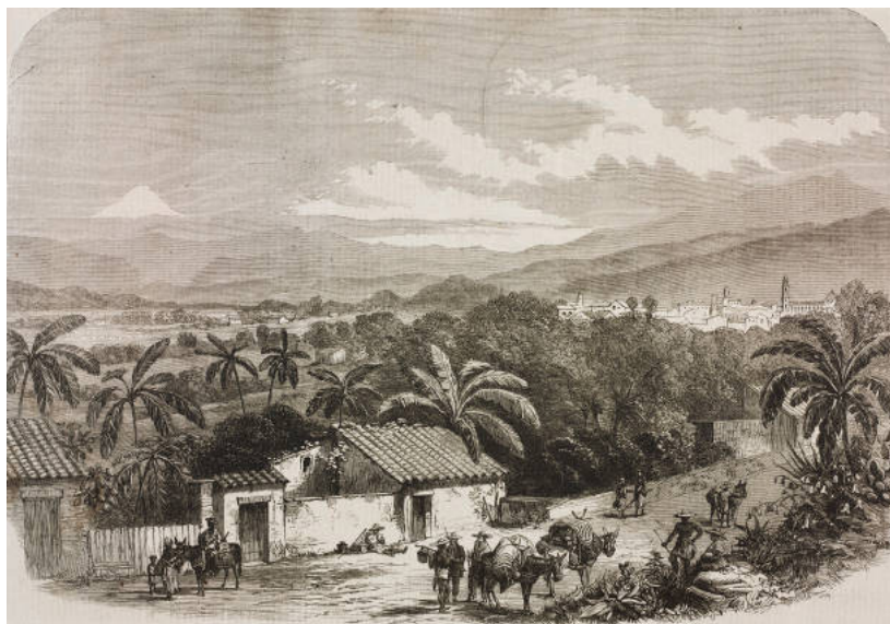
Figura 3. Paisaje de la Villa de Xalapa

Fuente: London News, volume XL, March 29, 1862.