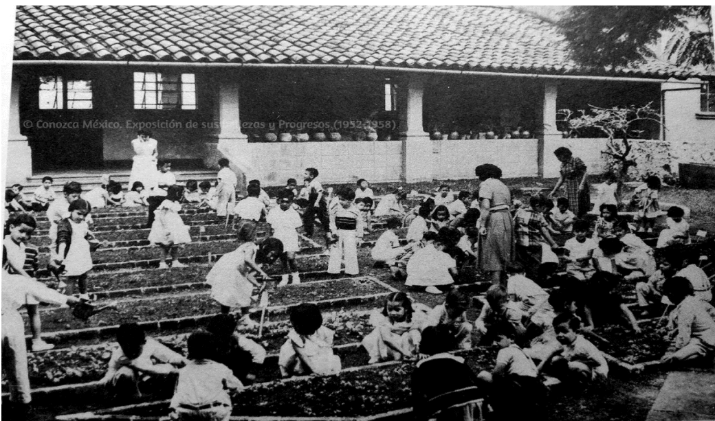
Figura 4. Huerto escolar del Jardín de Niños Enrique Pestalozzi en el centro de Xalapa

Nota. El huerto escolar no existe actualmente.