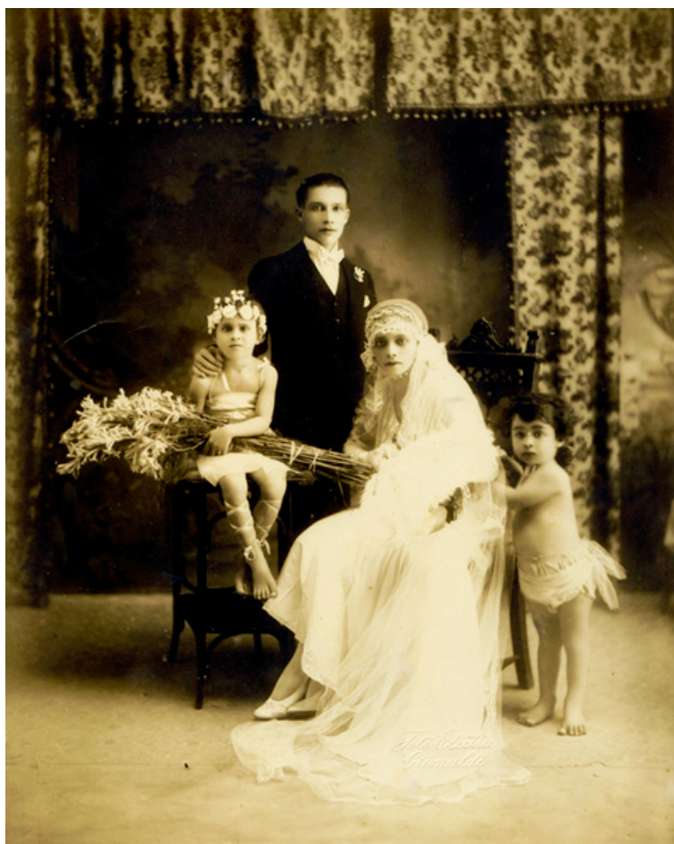
Foto de Matrimonio