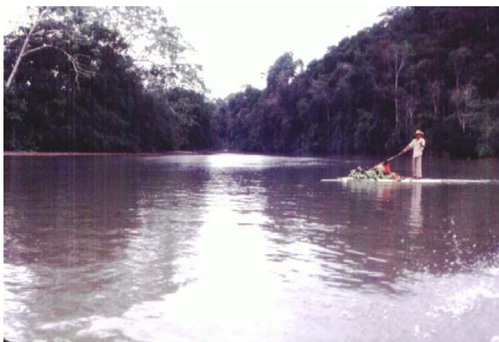
Otro viajero tras el rebusque que se encontraba aguas abajo del río Sinú.