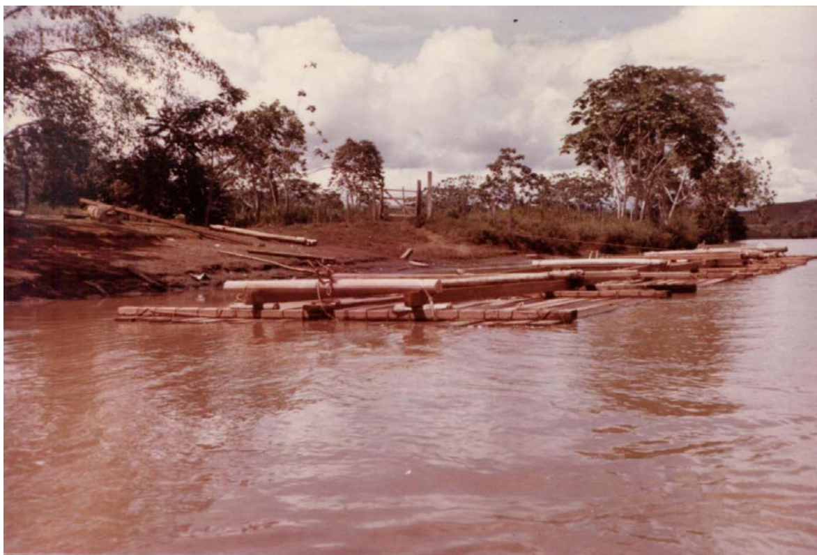
La madera arrojada al río era ensamblada en forma de balsas para facilitar su transporte hasta Lorica.