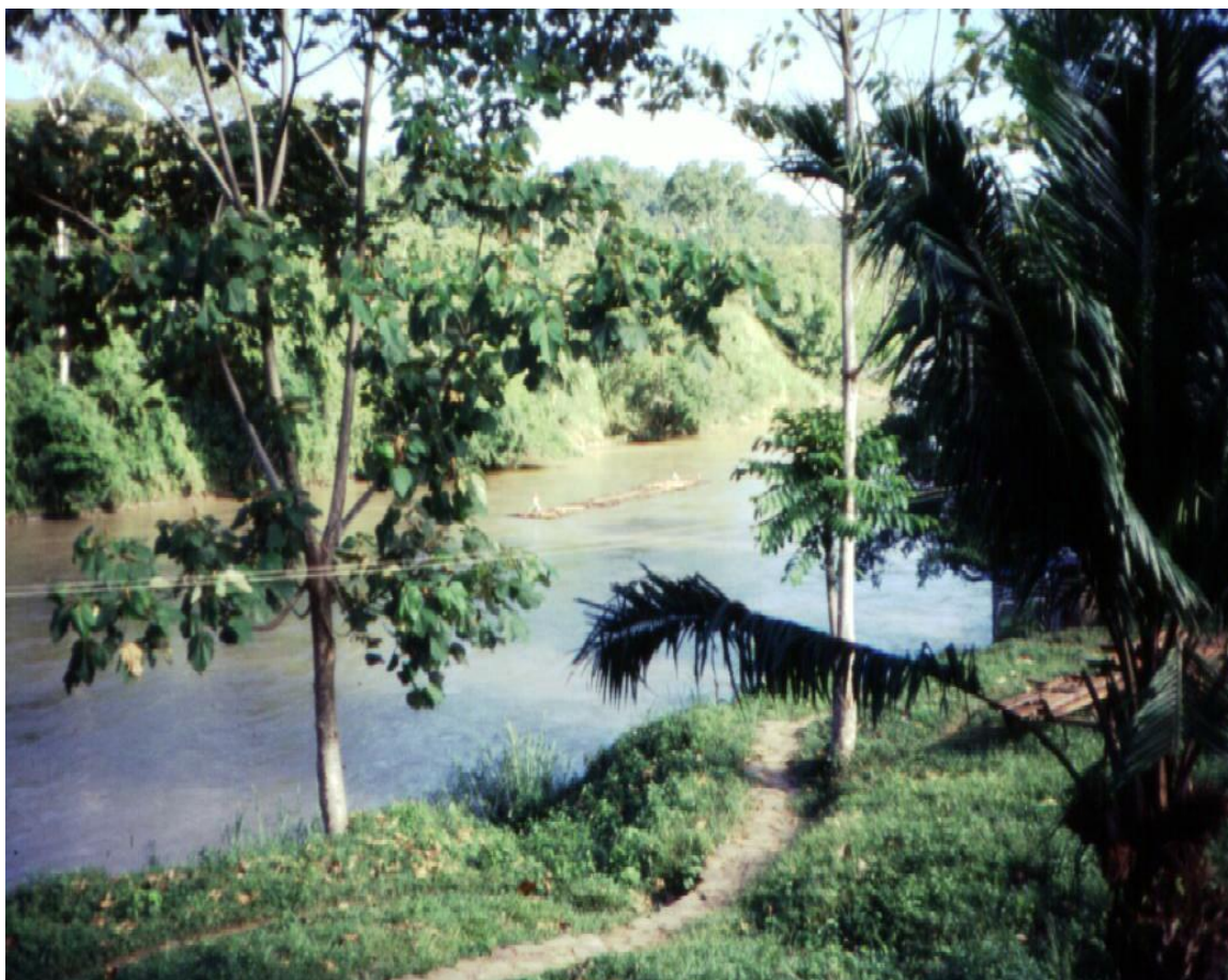
Una enorme balsa cruza por el frente del campamento de Urrá, en la localidad de Chibogadó. Una imagen ida para siempre, víctima del progreso.