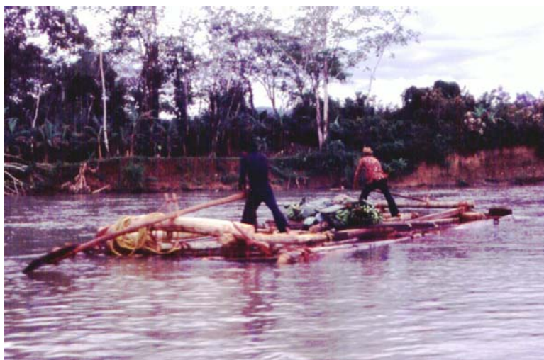
Una balsa río abajo con carga de plátano y yuca.