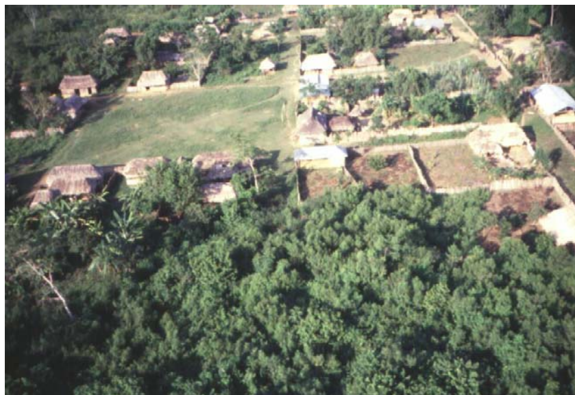
Foto aérea de la localidad de Chibogadó en el alto Sinú. Esta localidad desapareció bajo las