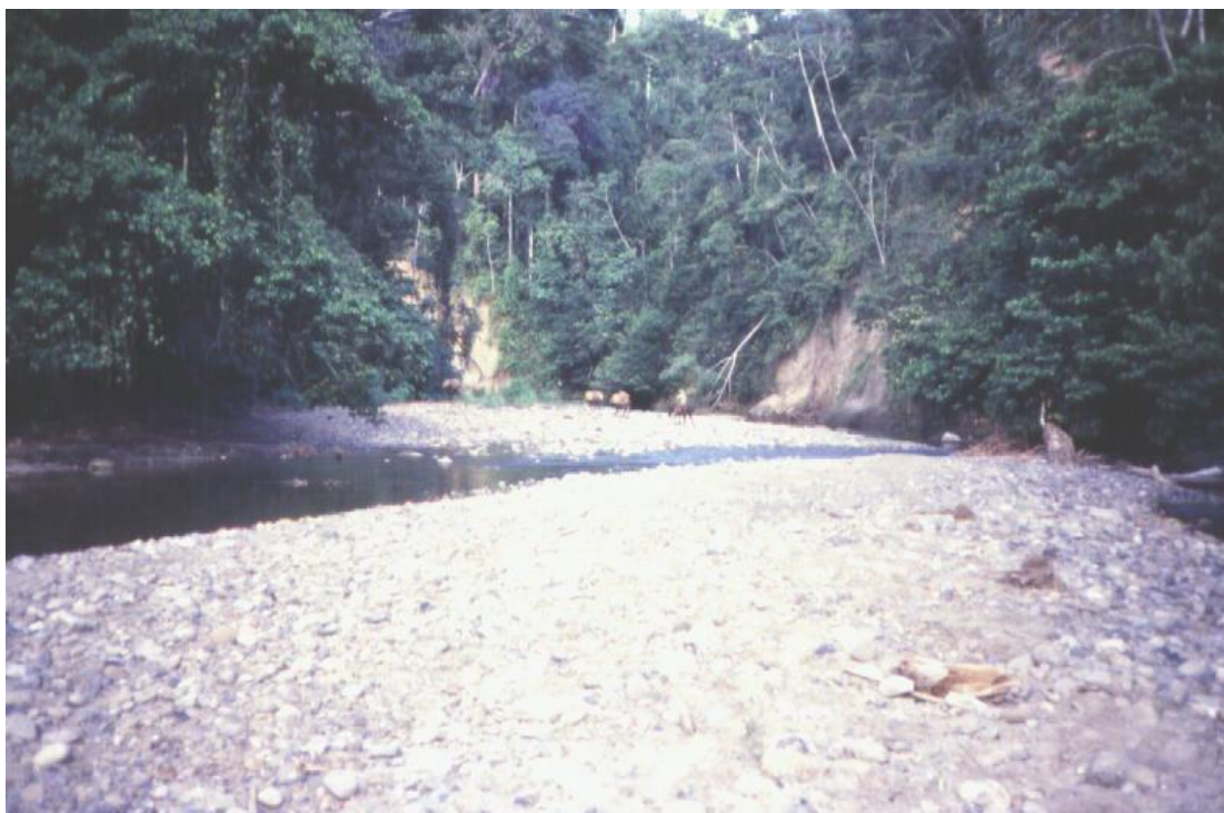
La Quebrada de Curucito afluente del Sinú. Otro paisaje que jamás será visto