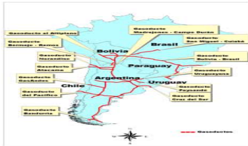
CONO SUR: RED DE GASODUCTOS DE EXPORTACIÓN