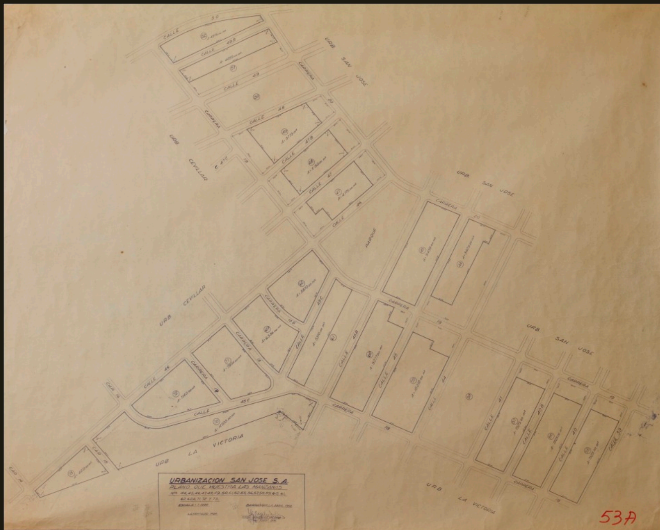
Plano 3. Urbanización San José. 1945