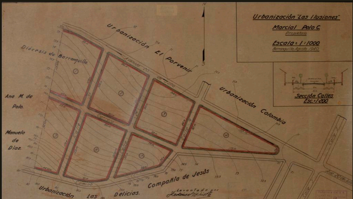
Plano 5. Urbanización Las Ilusiones. 1939-1940