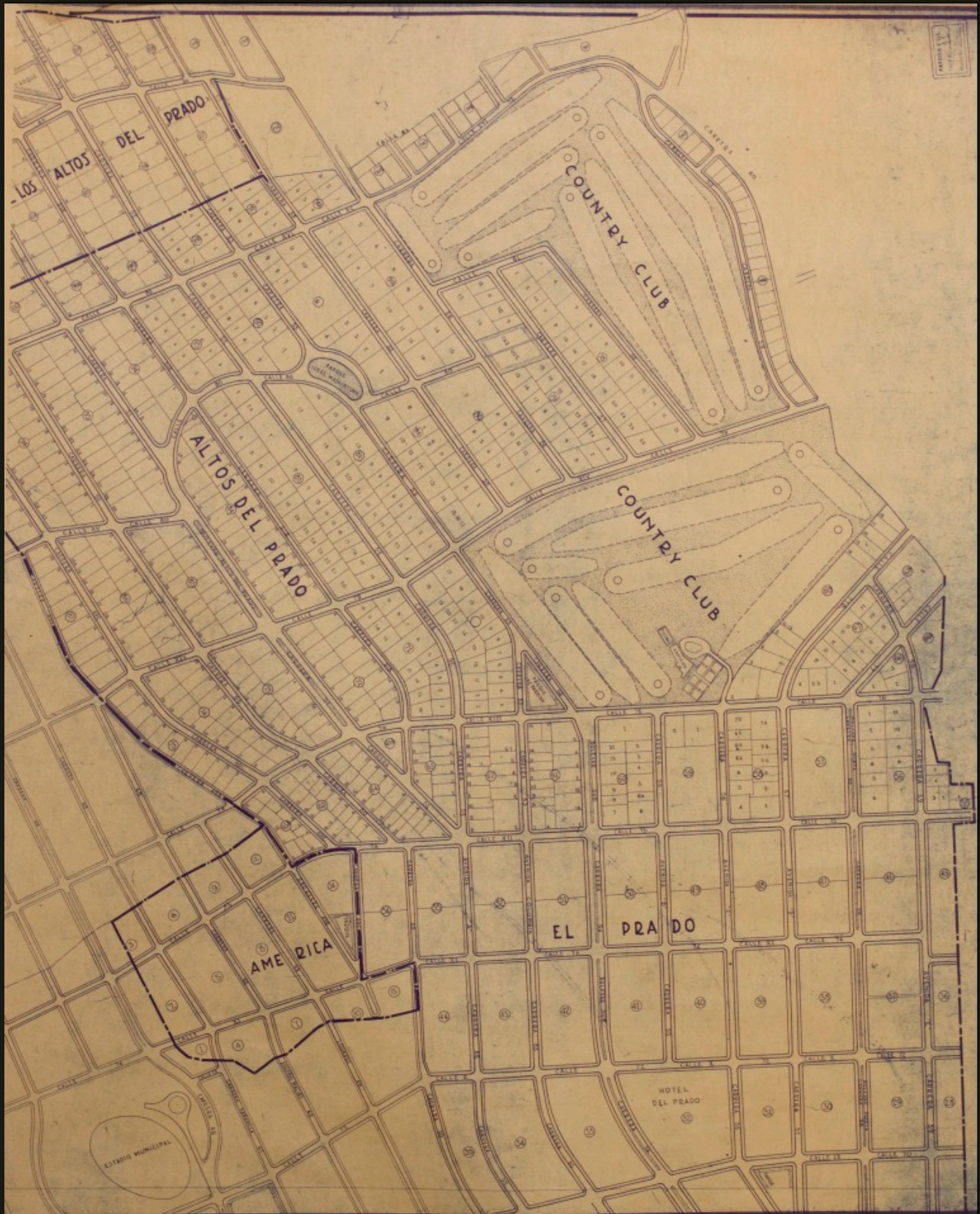
Plano 1. Urbanización El Prado. 1920