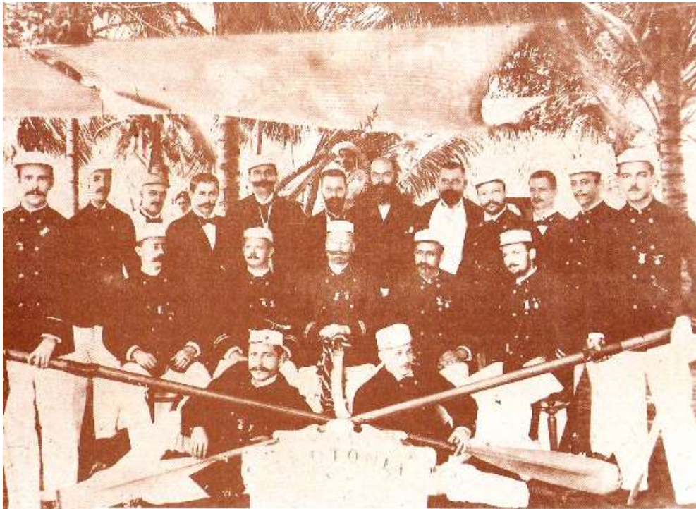
Club alemán de Remos de Maracaibo

muchacha de Hamburgo, sino una tonta campesina... Cientos de ojos me miraban cuando puse el pie sobre tierra venezolana del brazo del señor Lüdert. Él me condujo entre una masa de gente de color que, en doble fila, llegaba hasta la casa comercial de Blohm y Cía., en cuyo primer piso estaba nuestro apartamento 6