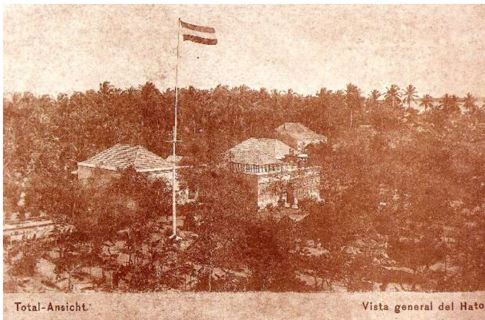
“Ranchería de los Haticos” (circa 1890)

Normalmente la temperatura oscila un máximo de 5 grados. Todo el año tenemos, durante el día, entre 25 y 27 grados Réaumur [31.25 y 33.75 °C] y por las noches, tal vez durante la época de lluvias baja a 21 ó 22 grados [26.25 ó 27.5 °C]. Esto es agotador... 36