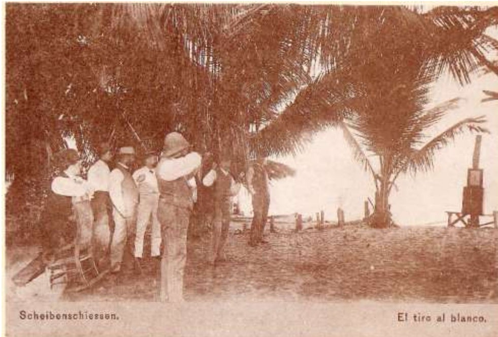
Tiro al blanco (circa 1890)

En carta del 26 de enero de 1896, escribe Elizabeth: “La salud de Rodolfo nos causa muchas preocupaciones, decididamente él ya no soporta el clima”. 47 Y en la siguiente de 27 de mayo: “