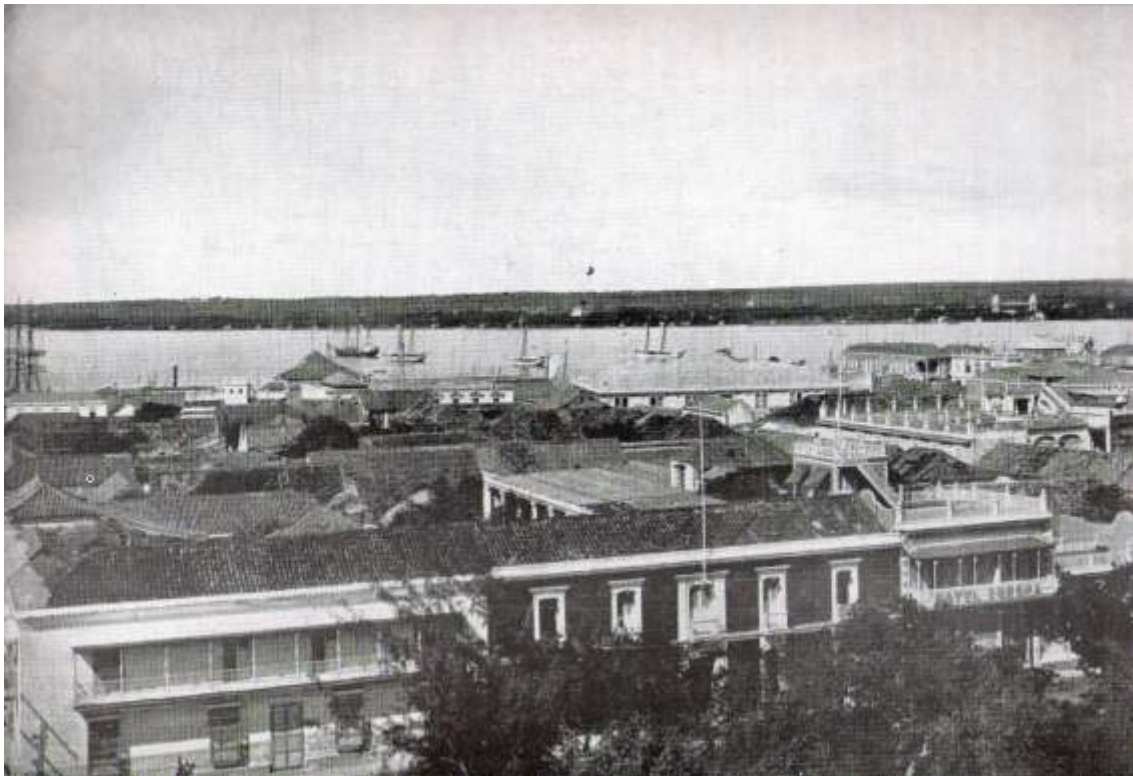
Bahía y puerto de Maracaibo (fines del siglo XIX)

sería novedad. Para ella, proveniente de un definido y avanzado modo de vida sajón no sería fácil adaptarse.