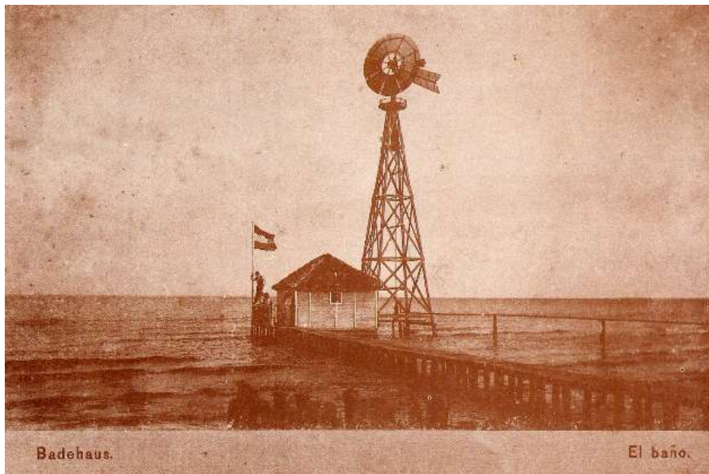
“Caseta de baño” (circa 1890)

escalera y prueban el agua con el dedo grande del pie... En el camisón de baño de mamá se capturan toda clase de pequeños, atractivos y brillantes pececillos 37