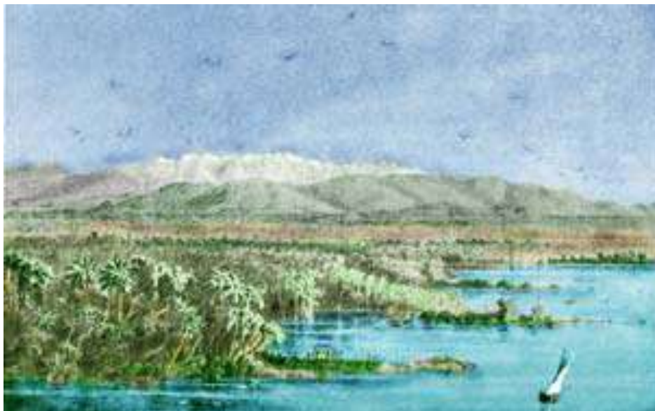
“Llanura zuliana con la cordillera al fondo” (Cristian Anton Göering)

Luego de cruzar el Lago durante la noche amanecieron en las orillas selváticas de La Ceiba. Desde la borda del barco contemplaron la majestuosidad de las cumbres nevadas andinas.