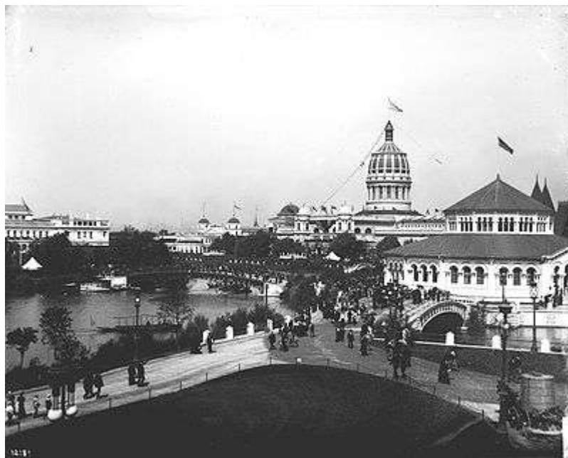
Exposición Universal de Chicago (1893)

En relación con la Feria escribe Elizabeth: