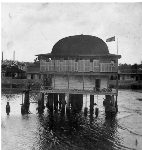
Templo masónico de la logia Unión Fraternal de Puerto Limón.