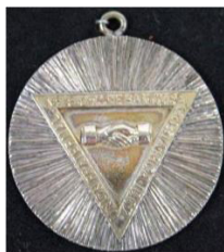
Escudo de la logia Unión Fraternal de Puerto Limón, organizado en 1892.