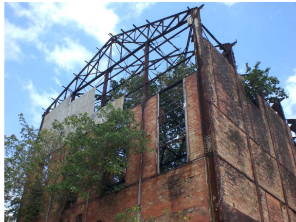
Figure 4. Usine Marquisat des Sucreries d'Outre-mer, au centre de la ville de Capesterre-Belle-Eau, fermée en 1968. Photo de 2011.

L'État ne compte plus sur l'industrie sucrière, et offre d'autres voies de développement. Le 26 avril 1963 une société d'Etat dite « Bureau pour le développement des migrations intéressant les départements d'outre mer » est créé. Sans l'aide des entrepreneurs, sans rapport avec l'industrie sucrière, sa mission consiste à prendre en charge le développement du territoire en organisant la migration d'une partie de sa jeunesse,