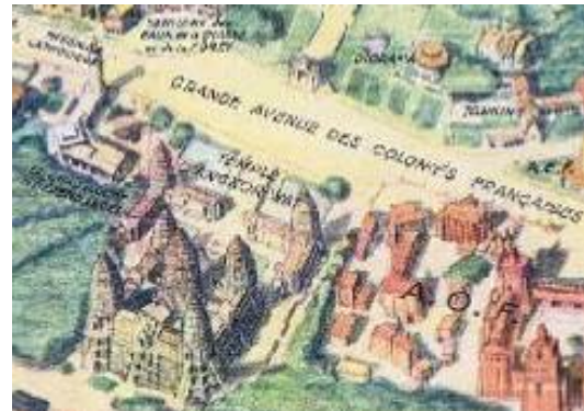
Figure 3. Situation du pavillon de la Guadeloupe à l'exposition de 1931 à Vincennes.

Gratien Candace 24 , député de Guadeloupe, dépose une proposition de loi 25 pour que les Sociétés de capitaux ayant leur siège et leur exploitation aux colonies soient soumises exclusivement à la législation fiscale locale en ce qui concerne les impôts sur les titres et les impôts sur les revenus des valeurs mobilières.