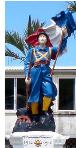
Figure 2. Monument aux morts de Pointe-noire.

La Première Guerre Mondiale renforce les liens entre la Vieille Colonie et sa métropole. Les Guadeloupéens ont payé l'impôt du sang et leur appartenance à la France n'est plus à prouver. Reste à partager ce sentiment d'exaltation nationale de retour au pays. Les entrepreneurs vont y contribuer en participant aux expositions coloniales, mais surtout en organisant des manifestations de grande ampleur, pour fêter le tricentenaire de l'appartenance de la Guadeloupe à la France. Reste ensuite à faire accepter la nuance :