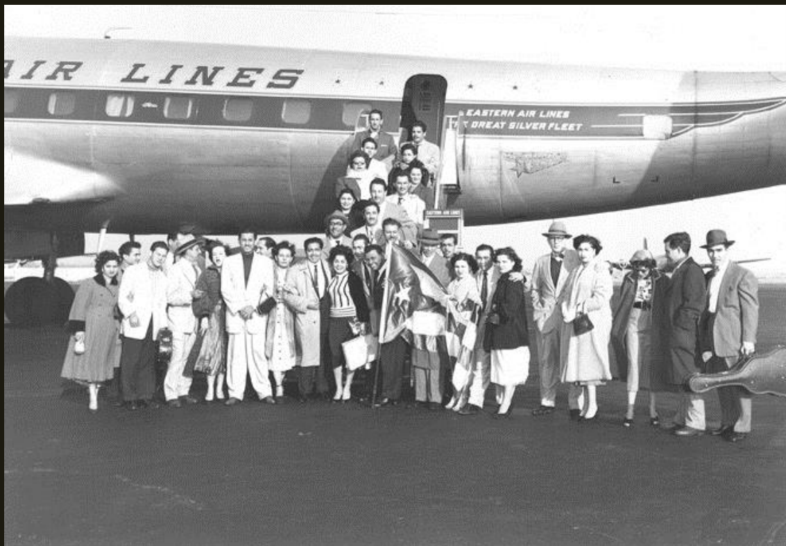
Gráfico 5. Grupo de músicos y cantantes puertorriqueños llegando a Nueva York"