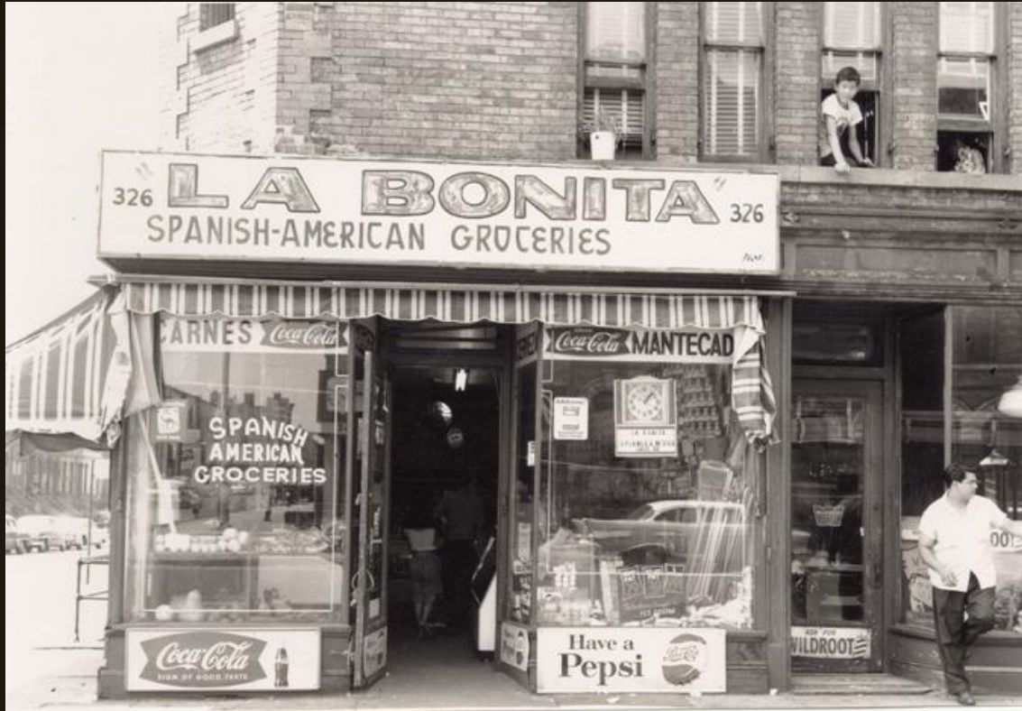
Gráfico 4. Foto- "La Bonita, Bodega (colmado) puertorriqueño"