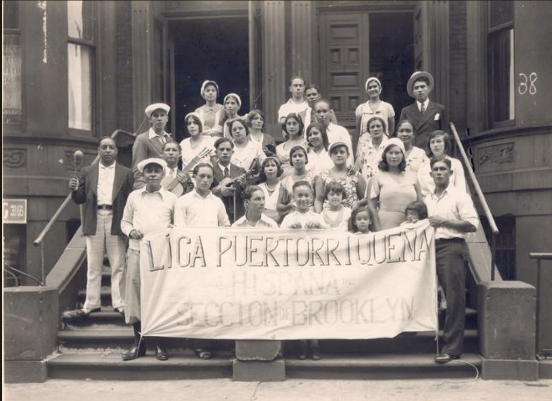
Gráfico 6. Evento de la organización Liga puertorriqueña