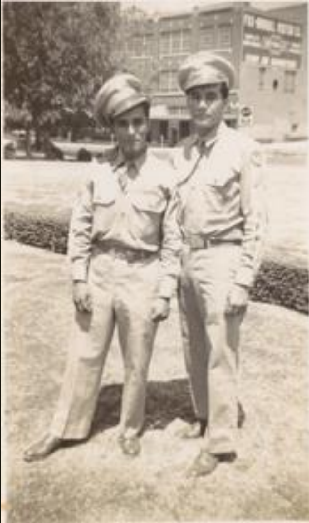
Gráfico 3. Dos soldados"- Colección Jesus Colón.