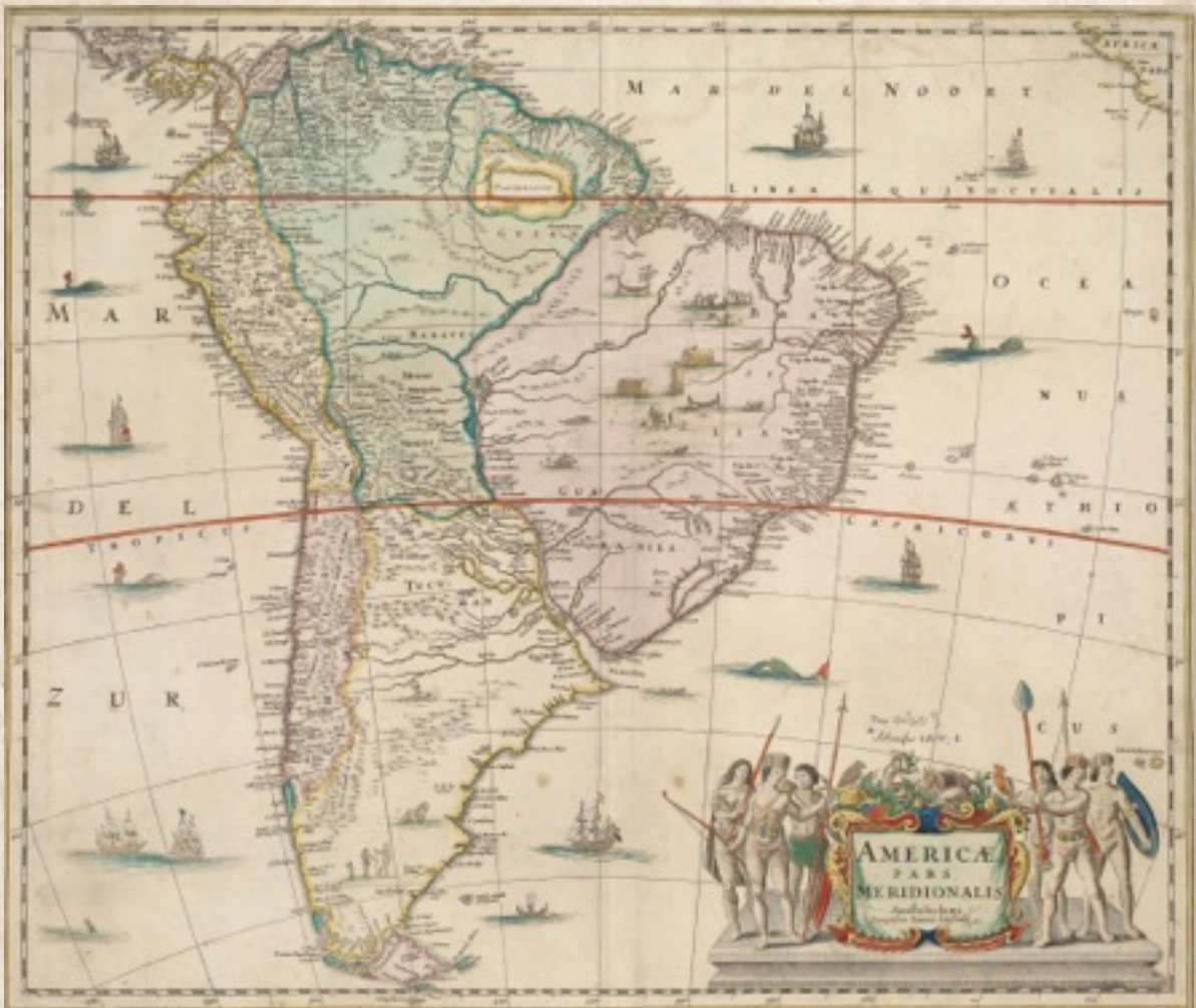
Figura 1: Americae pars meridionalis de Jan Jansson, 1644, Sur America, 17th Century.

brasileños. 19 Siguiendo a estos autores, en el límite occidental de la isla Brasil se encontraba una