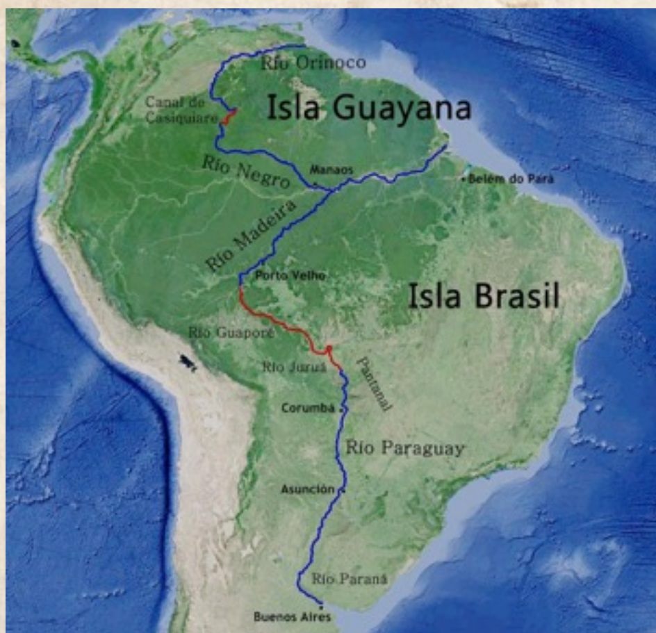
Figura 2: mapa suministrado por el autor.

forma de mitos, tradiciones e incluso caminos marcados sobre la tierra. Las menciones anteriores sobre la laguna Xaraies (que probablemente aluda a la región del pantanal de Mato Grosso) son un ejemplo de este conocimiento, como también lo son las noticias sobre el camino del Peabiru y la existencia de un rey blanco en los Andes o el Altiplano: sucedió que a su llegada al estuario del río de la Plata, los castellanos conocieron la historia de un naufrago portugués que había llegado a la misma región unos años atrás. Este naufrago, llamado Aleixo Garcia, había sido adoptado por grupos guaraní que le habían confiado un valioso secreto: hacia el oriente, río arriba, vivía un poderoso rey blanco que acumulaba plata y oro. Aleixo García llegó incluso a participar en una expedición a la región (posiblemente siguiendo un camino nativo) y llegó a penetrar en el imperio