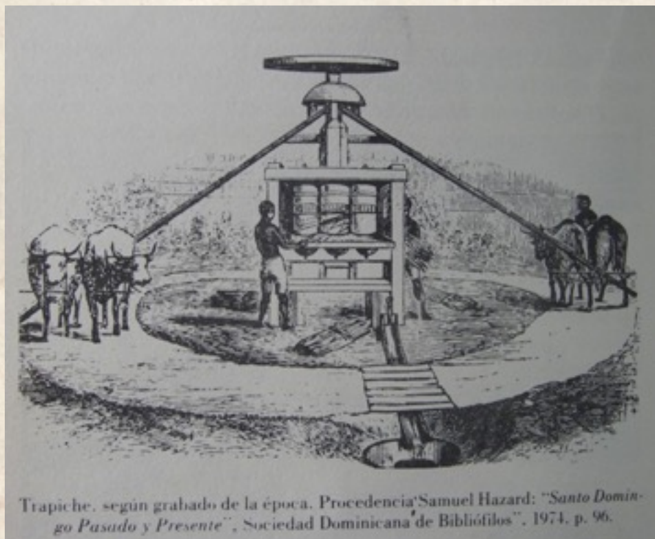
Trapiche. según grabado de la época.

necesaria de manera coyuntural. 29 Si bien de ésta manera se podían reconstruir vías y fortificaciones, los particulares, es decir, los propietarios de éstos esclavos, veían seriamente lesionados sus intereses, principalmente por la debilidad endémica del mercado de esclavos, que amenazaba en convertir en algo cotidiano una política que se aplicaba de manera excepcional y puntual. Además, la captación de la fuerza laboral de los esclavos de particulares por parte de las autoridades ponía serias trabas al fomento de la agricultura. Conscientes de las dificultades que acarrearía en un plazo inmediato esta política, las autoridades dominicanas reclamaron que se instalaran en Santo Domingo, procedentes de San Juan de Puerto Rico, doscientos presidiarios, para que cumplieran allí condena realizando los trabajos de reparación de vías y fortificaciones. 30 La