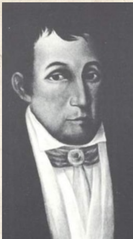
Figura 1: José Núñez de Cáceres nació 14 de marzo de 1772 Santo Domingo colonial y murió 11 de septiembre de 1846 en Tamaulipas, México.

isla. Los temores de los dominicanos se confirmaron apenas dos meses después de la declaración de independencia, cuando se consumó la unificación política de la isla impulsada desde Haití. 5