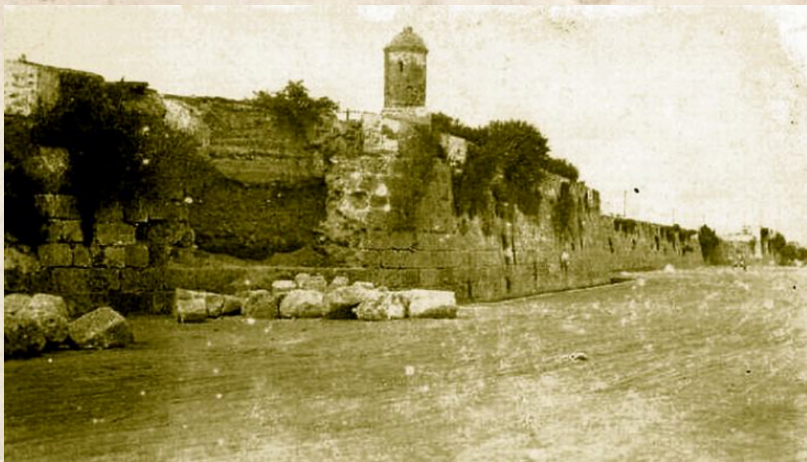
Figura 4: Baluarte San Andrés, San Diego, Matuna.

Con relación al control social desde el aparato escolar Libis Castellanos y Berena Pacheco plantean que: