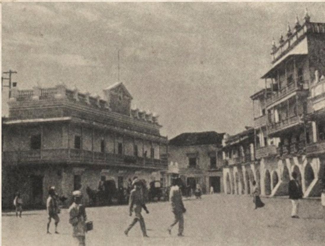
Figura 1: Plaza de los Coches. Tomado por los autores. de libro Azul de Colombia. Little Brown, 1918.

aversión social retroalimentaban la discrepancia de muchos individuos al orden social y coadyuvaba a recrear la imagen irreverente del hombre de machete en el cinto, temerario y pendenciero, que se paseaba en las ciudades retando a la autoridad, desplegando sus costumbres campesinas. 14 Defecar y orinar e incluso desnudarse en espacios visibles eran actos y conductas espontáneas cotidianas que exhibían una absoluta carencia de valores urbanos. Tras ellos se visualiza la supervivencia de las costumbres tradicionales, que marginaba valores como el pudor y la buena reputación. Todo esto quedaba en un segundo plano, ante la urgencia de satisfacer las necesidades fisiológicas. La ciudad, soporte del discurrir biológico y social, era el espacio donde el poder intentaba imponer controles legales, pero en la realidad del pueblo; la ciudad era igualmente el espacio para el desarrollo de la