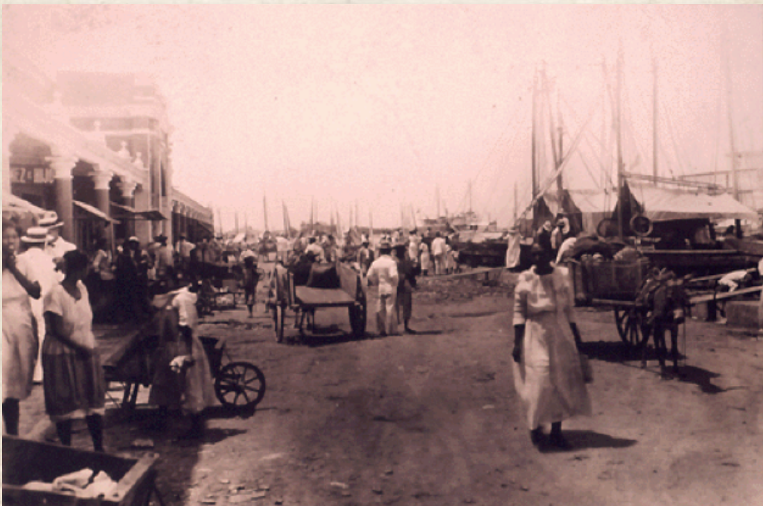
Figura 3: Cartagena de Indias en el siglo XIX.

período radical cuando se tomaría la implementación de la educación como un objetivo estratégico del proyecto estatal del Olimpo liberal, que se materializaría con la reforma educativa de 1870. Suprimamos la ignorancia, y habremos suprimido por completo el crimen en nuestra sociedad , rezaba una frase de la Gaceta de Bolívar de 1875. 48 La educación sería asumida como el mejor medio de construcción del hombre civilizado y del ciudadano moderno. En este sentido, lo contrario