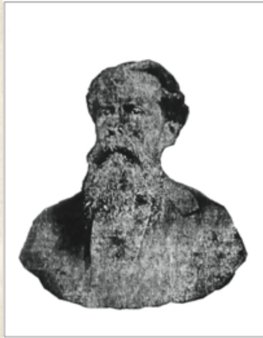
Figura 1: General José Félix Fuenmayor Parra.

alcantarillado, planos de la ciudad, estudios para la composición de calles y la desviación de las corrientes de las partes más altas de la ciudad. 5