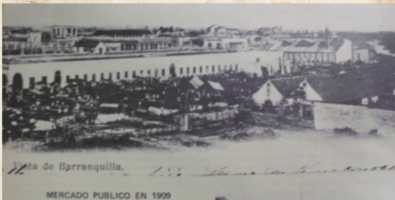
Figura 2: Mercado Publico en 1909.

y una altura de 0, m 64, c cubierta de un envigado forrado de ladrillos hasta la superficie del suelo; llevando en su fondo una inclinación constante de 10 2 100. Véase en el plano N°3 dibujo (C,) el detalle en escala mayor de 0, m 65 c por metro que representa la sección.