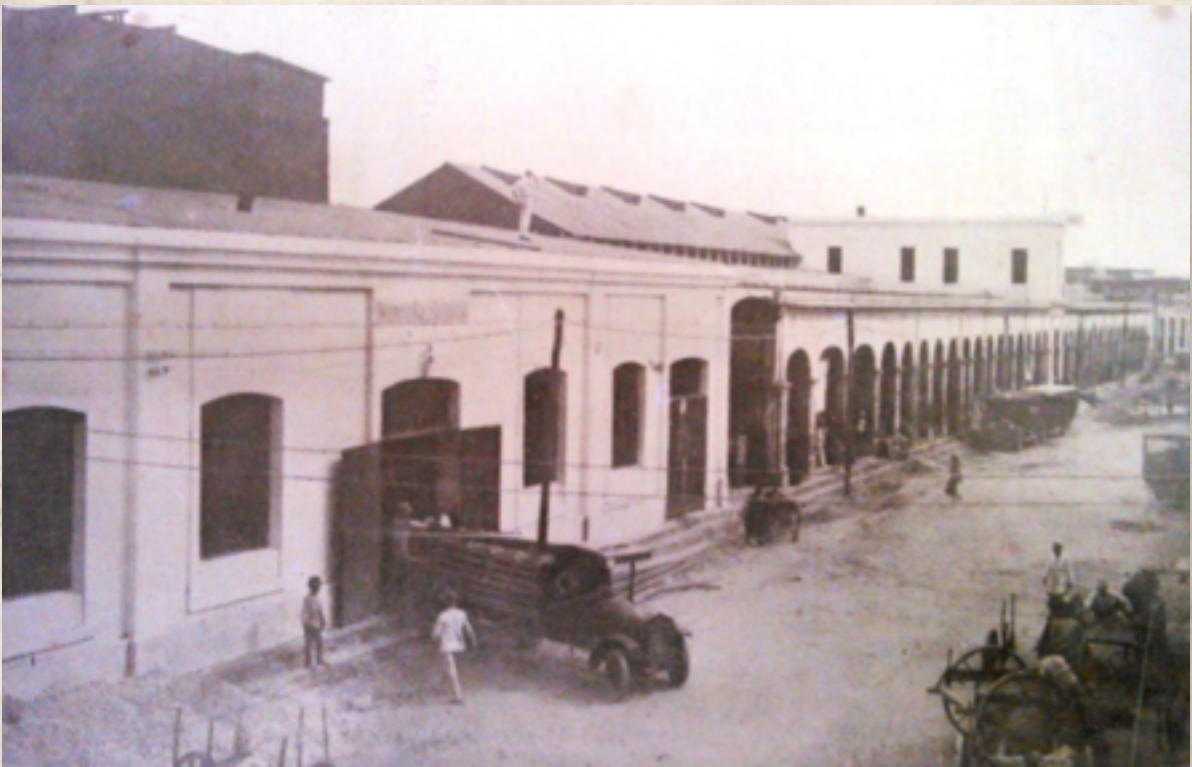
Figura 3: Mercado Público de Barranquilla a finales de la década de 1920. Imagen tomada de: Rash Isla, Enrique, Directorio Comercial Pro Barranquilla. Barranquilla: Sociedad De Mejoras Públicas, 1928, pág. 223

Constituye el edificio un techo de dos aguas muy bajo, cubierto con tejas de la forma antigua. Sostenido por 36 pilares de ladrillos; está dividido en diez y seis cuartos laterales y un pasadizo central, los tabiques que forman los cuartos son de rejas ligeras de madera el pasadizo se cierra por ambos extremos con dos puertas de rejas, de madera también.