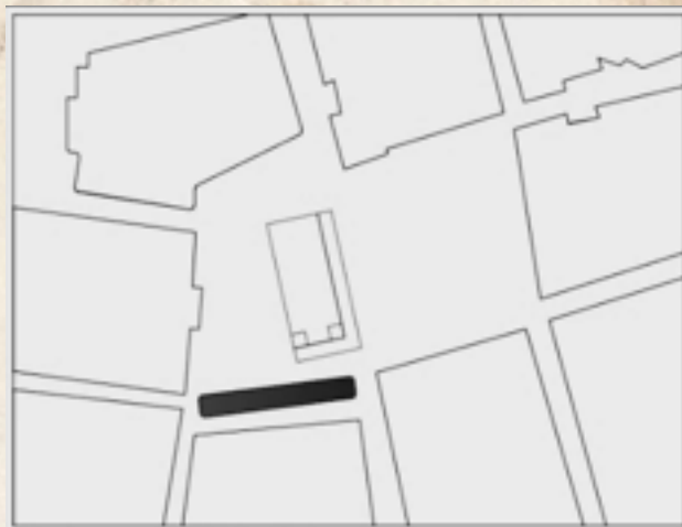
Figura 5: Camellón Once de Noviembre en 1920. Fuente: Esquema de Gilberto Martínez Osorio. 2015.