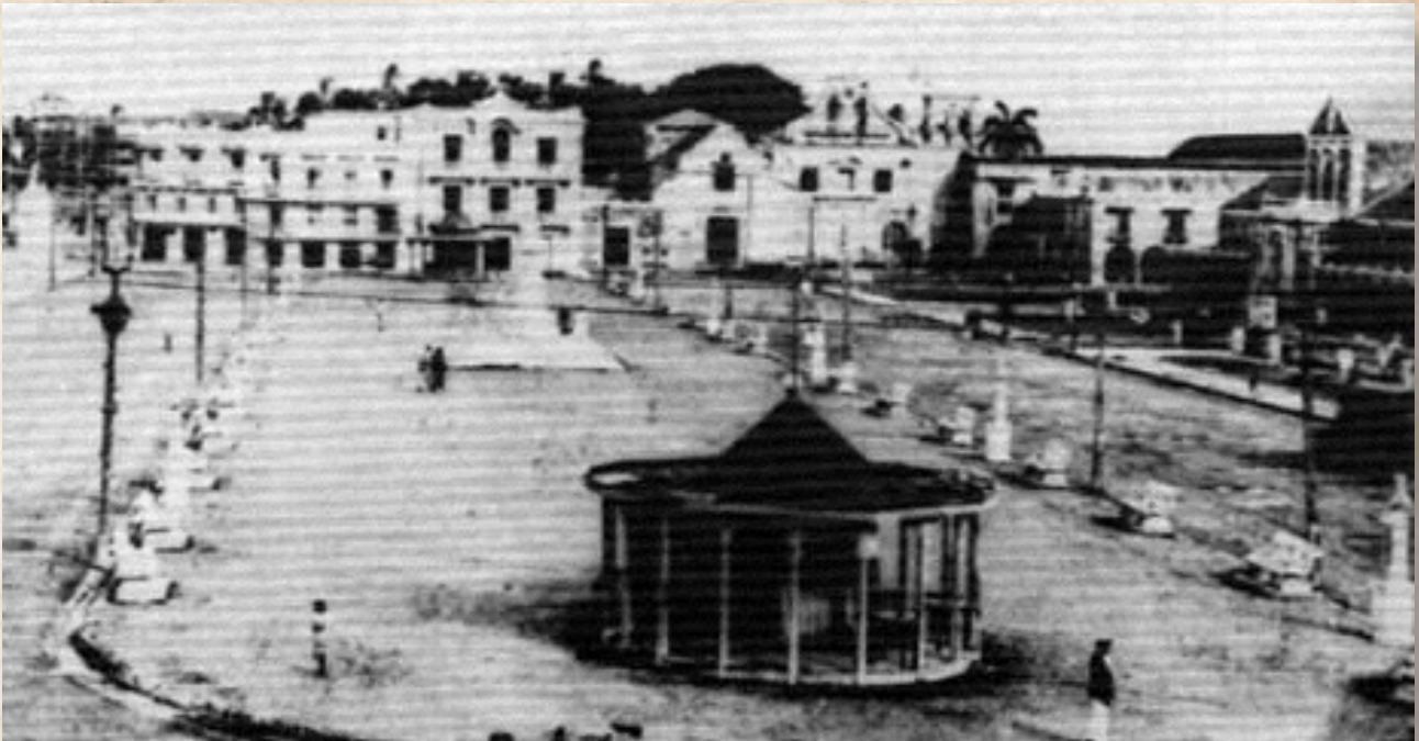
Figura 2: Camellón de los mártires de Cartagena a comienzos del siglo XX.

Desde la interpretación de Pérgolis, en sus investigaciones sobre el deseo de modernidad, el “ Camellón de los mártires ”, hace parte de una serie de esfuerzos por superar el modelo colonial predominante en el ordenamiento de la ciudad, y, reinventar la ciudad del futuro, donde el estilo neoclásico, aplicado a las formas, hace parte fundamental del proceso. El tema es de enorme importancia cuando se mira el contexto de Cartagena como Capital del Departamento de Bolívar, unidad administrativa de la que los sincelejanos se están tratando de independizar, pero que, desde una mirada cultural, parecen mantener como referencia, al replicar algunas de sus innovaciones urbanas.