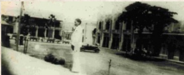
Figura 6: Fotografía de un joven. Autor desconocido. Fototeca Municipal de Sincelejo.