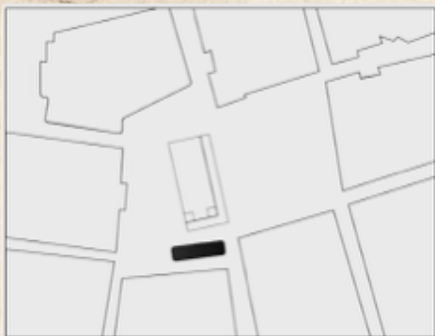
Figura 4: Camellón Once de Noviembre en 1909. Fuente: Esquema de Gilberto Martínez Osorio. 2015