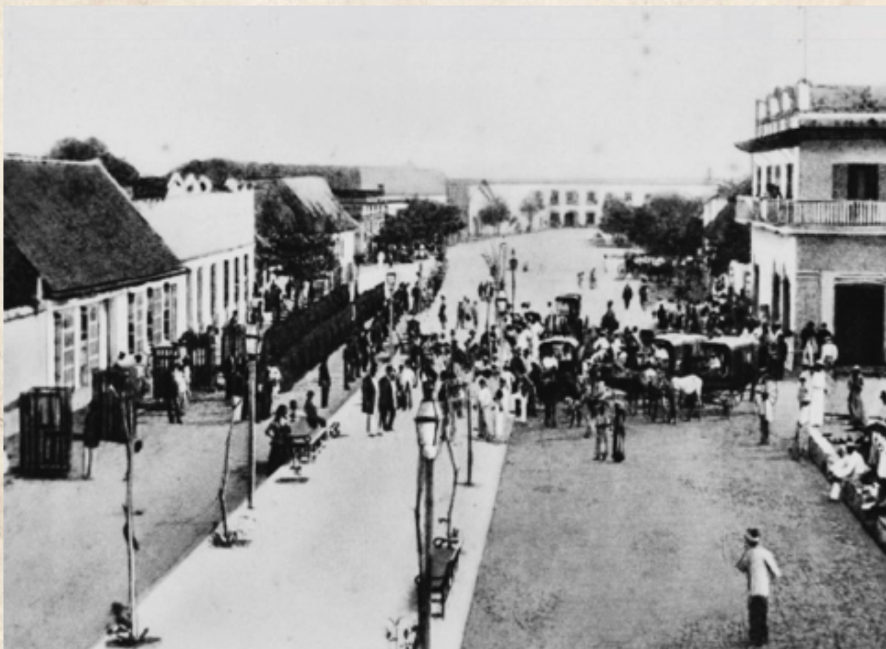
Figura 3: Camellón Abello de Barranquilla.

ra urbana resultaba ya, en 1913, insuficiente para las crecientes demandas de la población sincelejana.