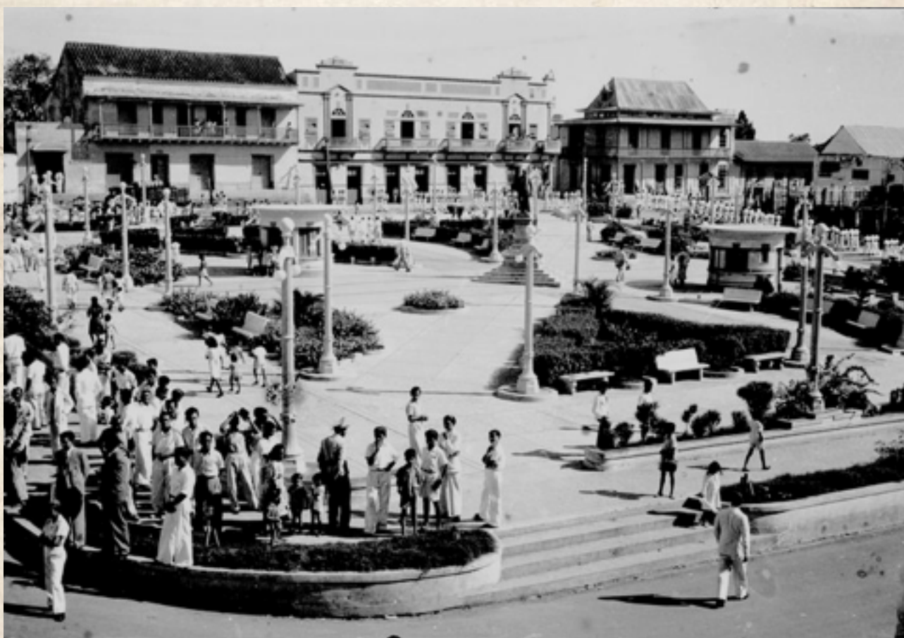
Figura 10: Parque Santander de Sincelejo. 1944.

En el año de 1944, Sincelejo concreta un proceso progresista que implica importantes cambios culturales para la ciudad, el desplazamiento definitivo de las “ Fiestas en corralejas ”, de la plaza principal, hacia la periferia, en ese entonces, el sector del barrio Majagual. Proceso que se define a partir de la introducción de un nuevo concepto urbano, hasta el momento inédito en Sincelejo, “El parque”. La construcción del “ Parque Santander ”, define las ambiciones de los grupos progresistas de la ciudad por la generación de un espacio de socialización acorde a las nuevas necesidades, al crecimiento y a los deseos de la ciudad.