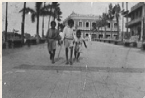
Figura 7: Niños en el Camellón Once de Noviembre.

meros, por “haber el Concejo no aprobado la forma del trabajo que se estaba construyendo” 33 . Comentario que confirma, que el proceso de construcción de 1920 corresponde a una obra pública, dirigida por la administración municipal, pero financiada a partir de aportes de la comunidad. Por el tipo de materiales comprados en las obras que se refieren a este proceso de 1920, se puede deducir, que se trata de una extensión del “Camellón” hasta la Calle del Comercio, estableciendo así, que la longitud del camellón fue variando a lo largo del tiempo, a partir de intervenciones y procesos de -