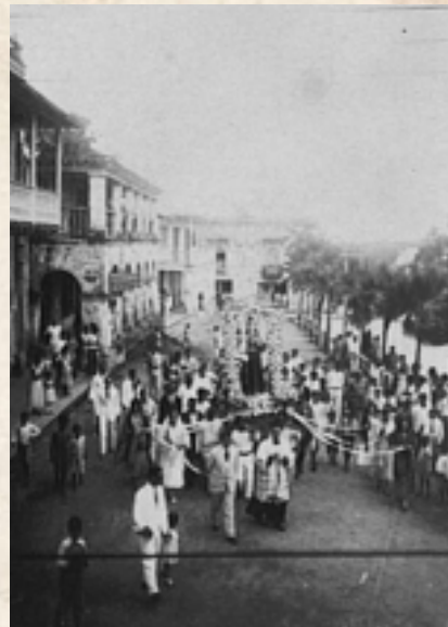
Figura 9: Procesión. Década de 1930.

mo “ kinicocamellonicas ” 49 , dejando entrever tal vez la frecuencia de su utilización, o tal vez el nivel de apropiación que el grupo generó con este lugar. Tertulias, que dentro de sus temas de interés y discusión incluyen, además de las películas, la revisión del nivel de civilización, progreso y modernidad de la ciudad en comparación con otras urbes a nivel regional e incluso mundial.