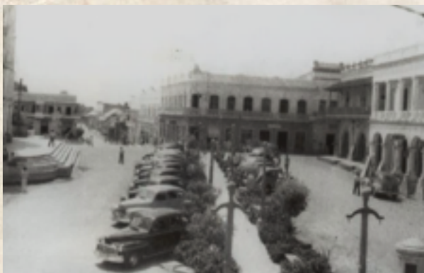
Figura 11: Camellón Once de Noviembre. Década 1950.