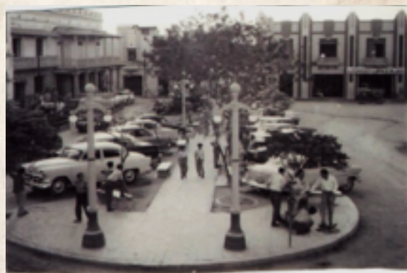
Figura 12: Camellón Once de Noviembre. Década 1950.