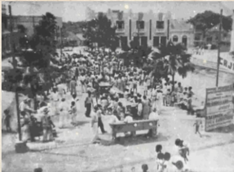
Figura 8: Tertulias en el Camellón Once de Noviembre. Década de 1930.