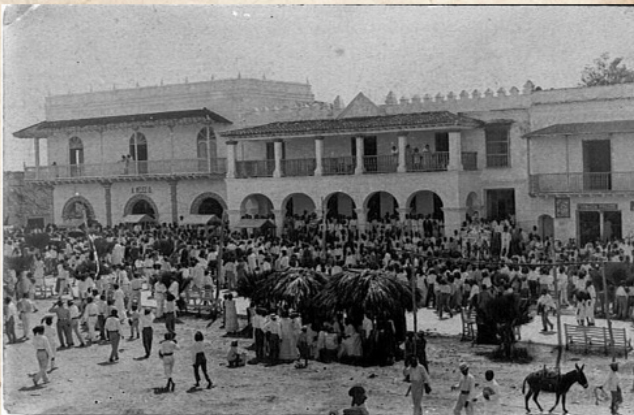
Figura 1: Camellón Once de Noviembre. Comienzos s. XX.

de estilo arquitectónico que se esté emulando, lo cual sería una particularidad para una obra construida a comienzos del siglo XX. Sin embargo si existe una referencia específica en relación a otros lugares, otras dos obras con la connotación de “Camellón” en la región del Caribe colombiano: