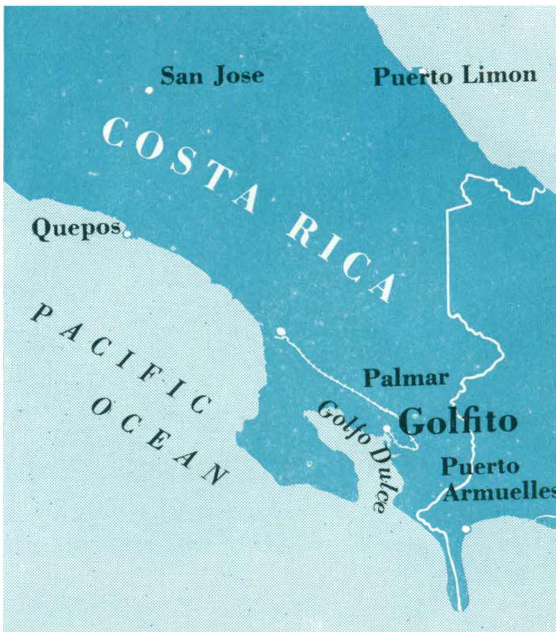
■ FIGURA 1. DIVISIÓN GOLFITO, 1949.