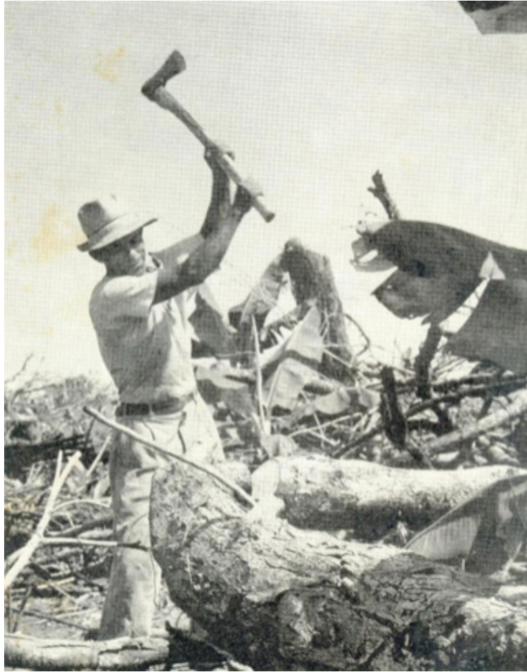
■ FIGURA 4. EL HACHERO.