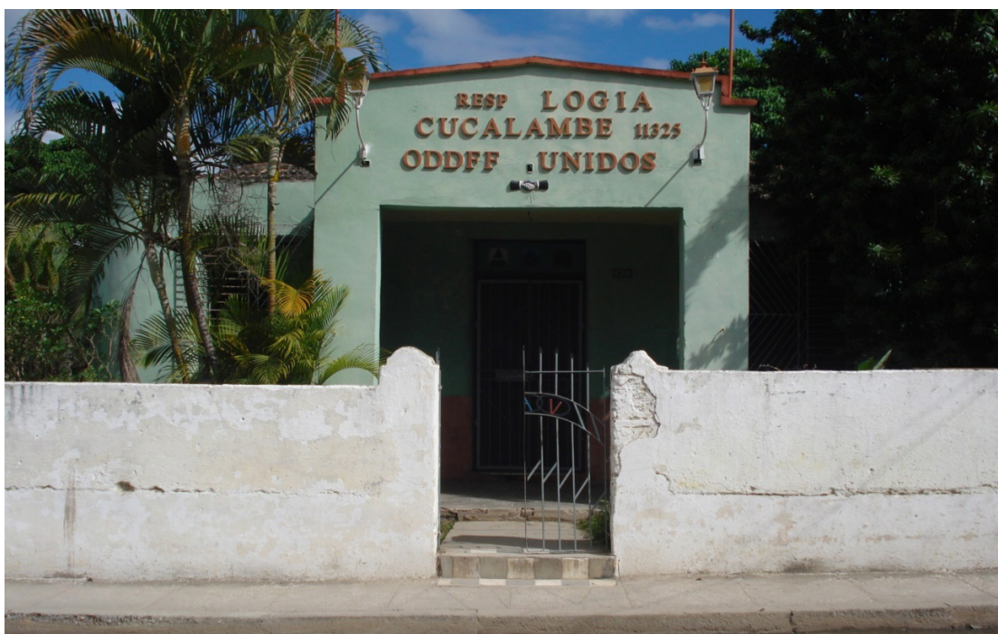
Respetable Logia Cucalambé N° 11325, de los Odd-Fellows Unidos, situada en la calle Julián Santana esquina A Cucalambé.