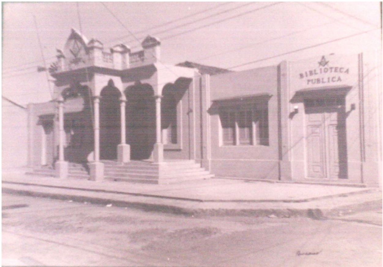
Logia Hijos de Hiram ampliada con la Biblioteca; aquí había desaparecido la cerca.