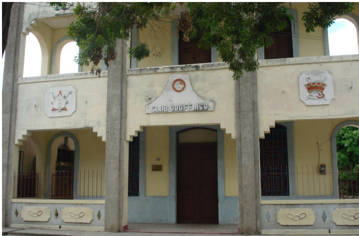
Respetable Logia Hijos de Oriente N° 54, de la orden Odd-Fellows Independientes, situada en calle Maceo, entre Lico Cruz y Lucaz Ortiz.