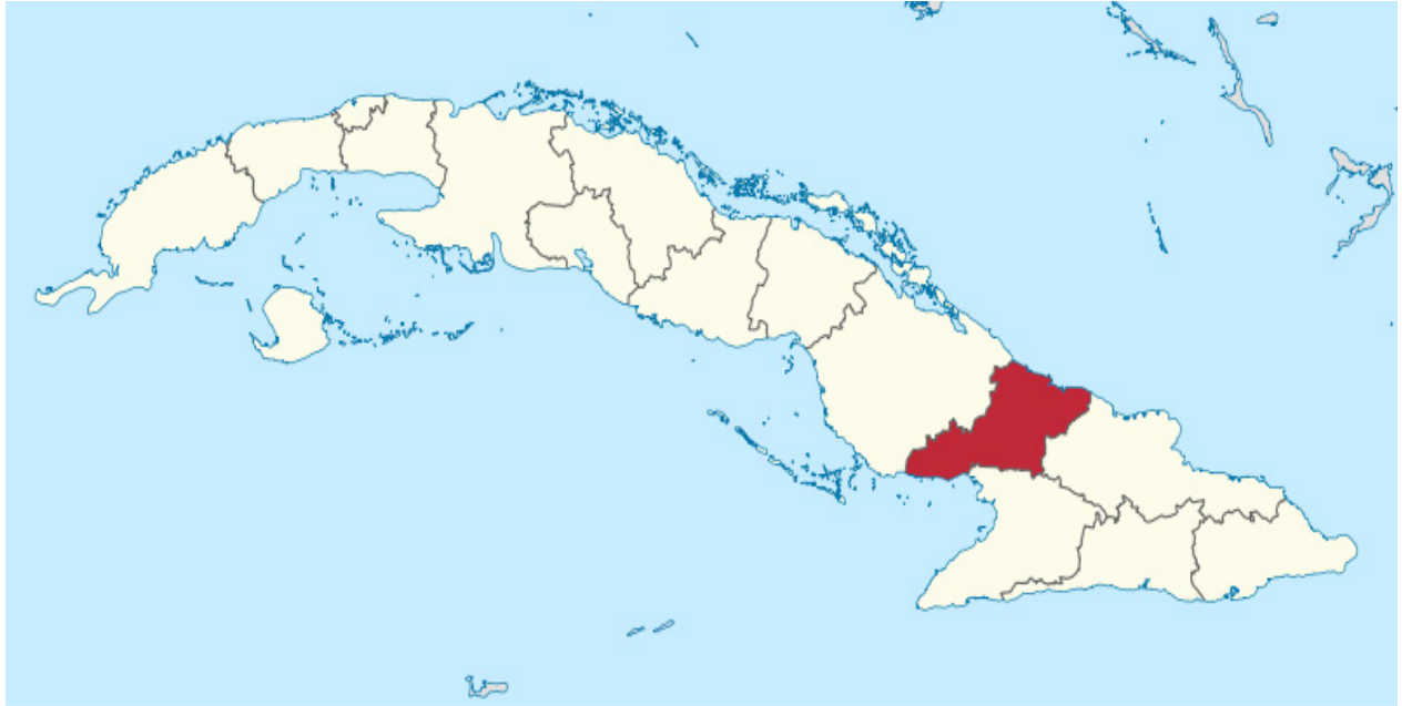
Mapa de Las Tunas y su ubicación dentro de Cuba.