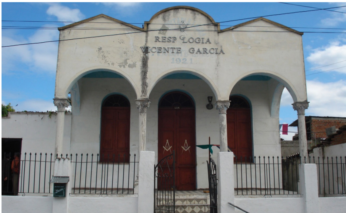
Respetable Logia Vicente García N° 57, de la orden masónica, situada en la calle Julián Santana entre Martí y Lico Cruz.