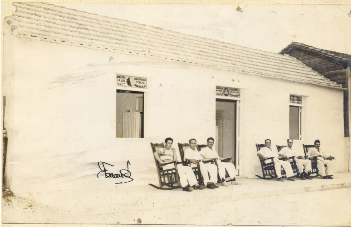
Respetable Logia Caballeros de la Luz.