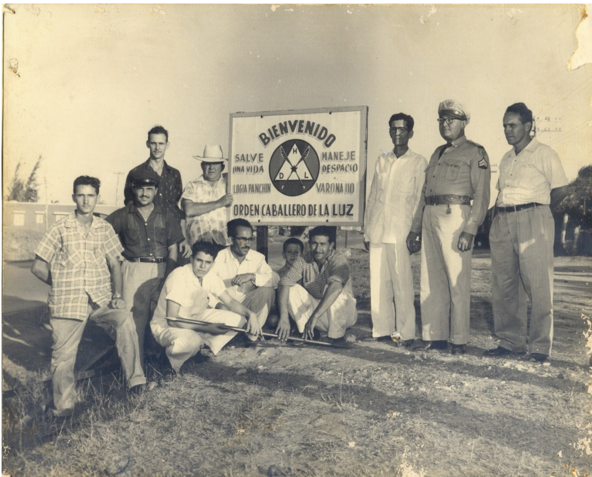
Muestra de las actividades de educación vial que realizaban los miembros de la logia Caballero de la Luz.