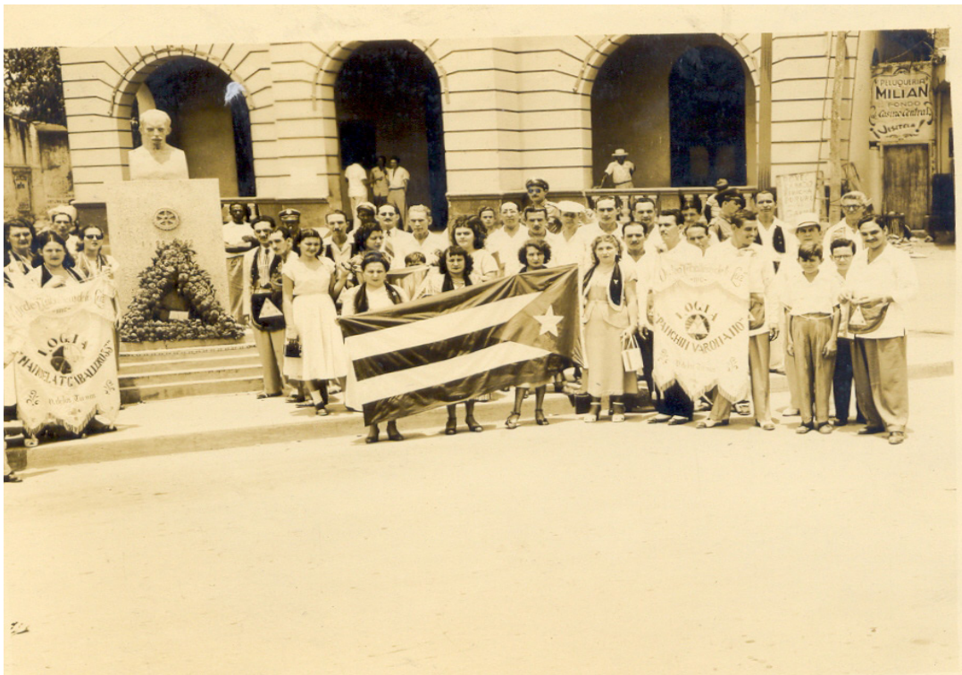
Algunas de las actividades realizadas por las logias de Las Tunas durante el período neocolonial; aquí depositaban ofrenda floral al busto de José Martí.