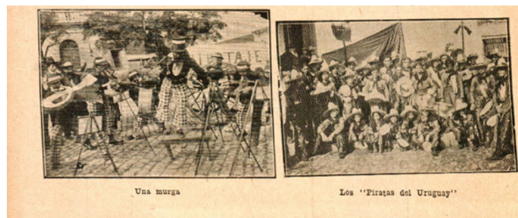
Figura 1: "El instrumento" murga