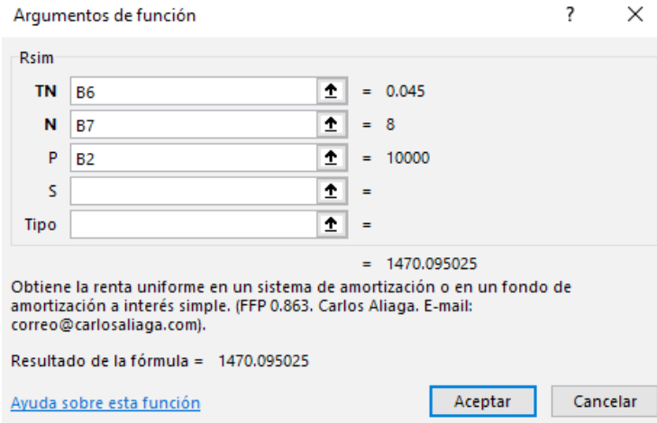
Figura 2. Función Rsim que resuelve la fórmula 2 y obtiene la cuota uniforme con interés simple

Con el importe de la cuota uniforme calculada como se muestra en la figura 2, se elaboró el siguiente modelo en una hoja de Excel.