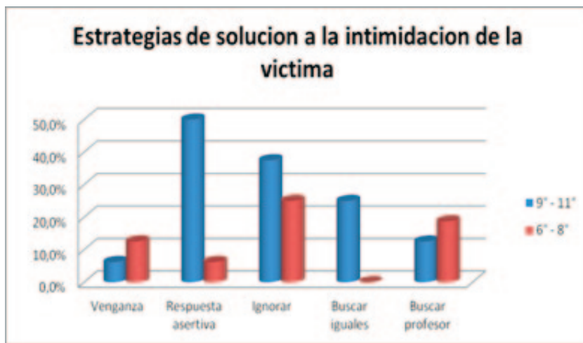
Figura 4. Estrategias de solución de la intimidación entre pares en el lugar de la Víctima; diferencia por grupo de edad

En cuanto a la pregunta ¿qué harían para sentirse mejor si fuesen víctimas? , manifestaron que “pondrían mucho más atención a su autoestima”, trabajando más al respecto para que las intimidaciones recibidas “no los debiliten”, “no asuman los señalamientos” de los intimidadores ni “experimenten los sentimientos” que ellos pretenden provocarles. Los participantes de menor edad expresaron que ellos pensarían que las agresiones “van dirigidas hacia otra persona”, con el fin de no creer “las cosas malas o desagradables” que el agresor dice de ellos.