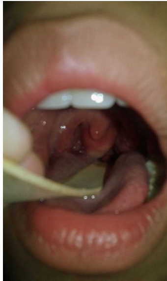
Foto 1. Apertura bucal. Aspecto externo del pólipo antrocoanal

Por este hallazgo se solicitó una tomografía computarizada de cavidad bucal y senos paranasales, en la cual se definió una masa de tejido blando en la nasofaringe y fosa nasal derecha, independiente de la pared faríngea posterior (foto 2).