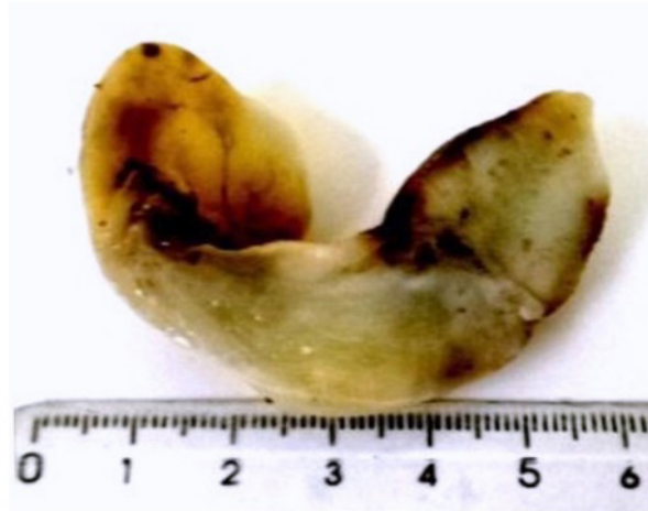
Foto 3. Pólipo resecado

Con estos datos se programó la resección quirúrgica de la masa nasal y mediante la técnica de Caldwell-Luc se retiró un pólipo de aproximadamente 6 x 1.5 cm (foto 3).