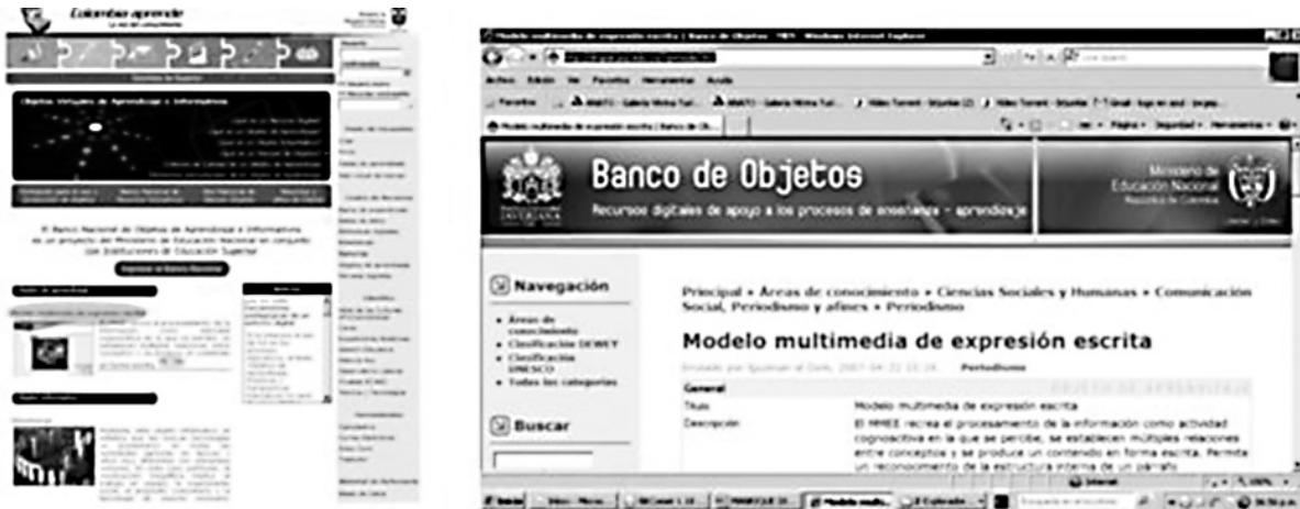
Figura 2. Interfaces del MMEE en el portal http://colombiaprende.edu.co del Ministerio de Educación de Colombia

Con el MMEE el usuario desarrolla una serie de operaciones (fase de entrenamiento) que lo van acercando al objetivo final de escribir una columna de opinión sobre el empleo en Cali. Para la representación computacional se estudiaron los modelos de segmentación de discurso derivados de las investigaciones desarrolladas por Marcu (2000) y Prada (2001). Con base en otros referentes como la Teoría de la Estructura Retórica (RST) y el programa Contexto, se dividió el problema de la argumentación en sus partes para que pudiera ser analizado por los usuarios del MMEE.