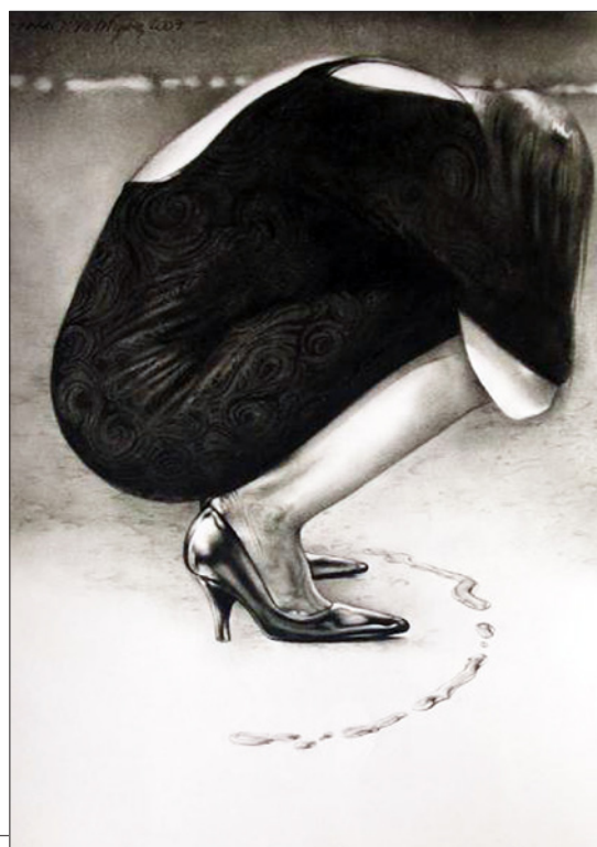
Roberto Rodríguez. Sin título , 2007. Lápiz de color diluido sobre papel, 35 x 25 cm.