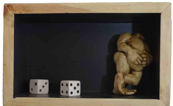
JOAQUÍN BOTERO EN CAJA DO 2, 3, 5